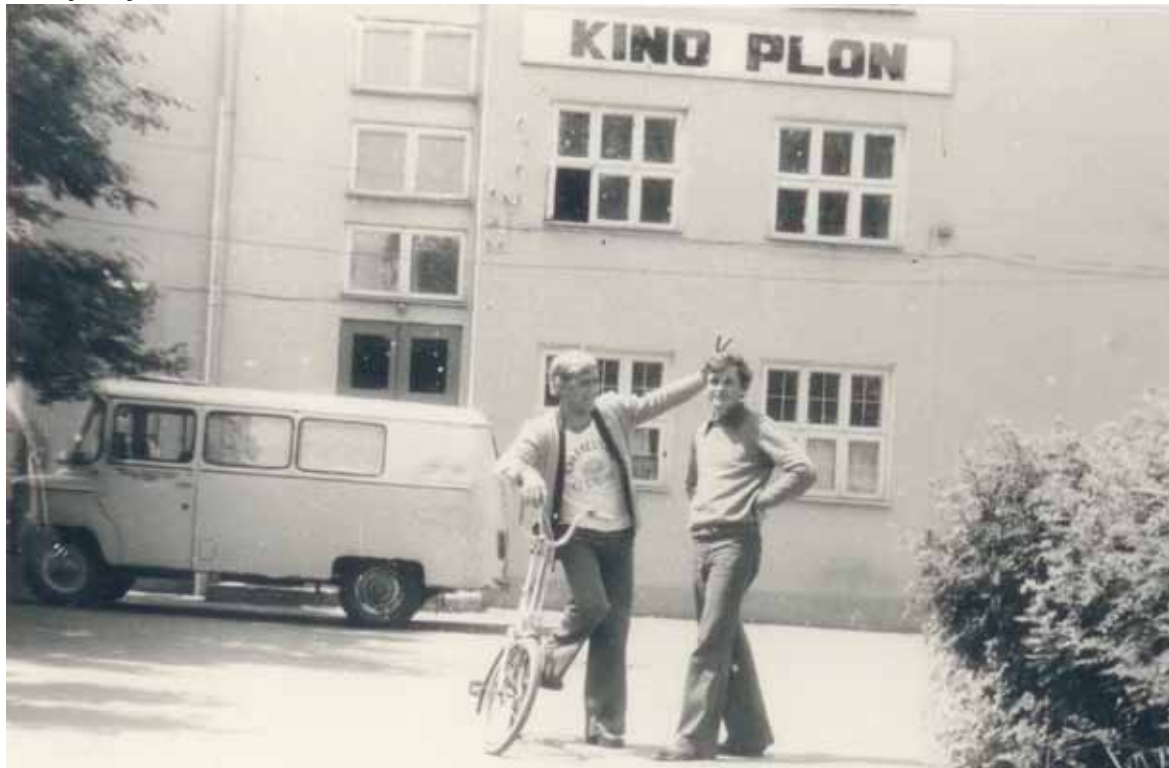
Spotkanie przed kinem w latach 70.

też Czerwone Gitary. Każdy występ ściągał do kina komplety publiczności.