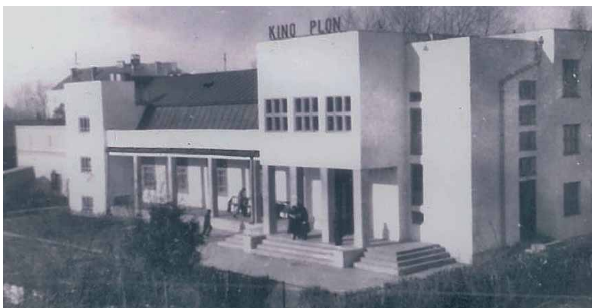
Dawny budynek kina