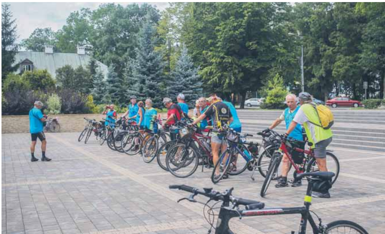
Wyścigi kolarskie w naszym regionie cieszą się coraz większą popularnością. Najbliższa kolarska impreza rozpocznie się pod koniec kwietnia

3.05 – 227. rocznica uchwalenia Konstytucji 3 Maja – uroczystości patriotyczno-religijne z udziałem pocztów sztandaro-