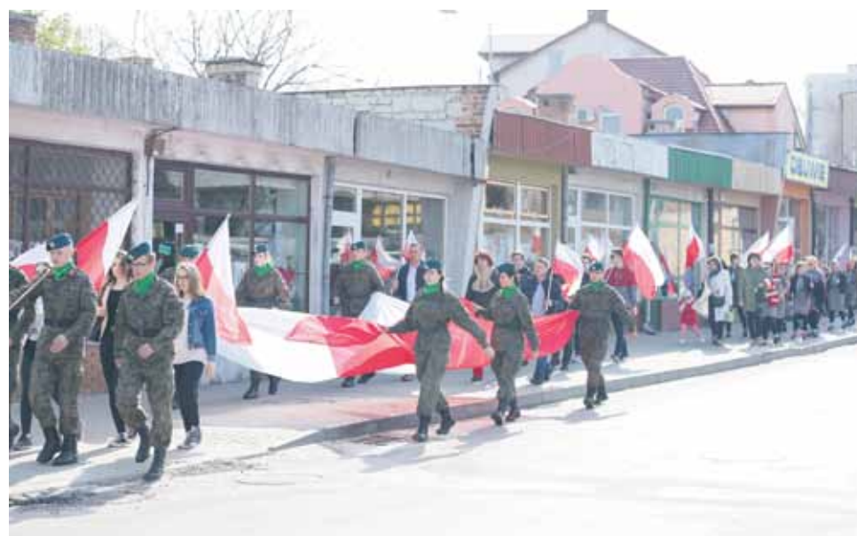
Na 2 maja w Hrubieszowie zaplanowano tradycyjne Święto Flagi

Turniej Piłki Nożnej „Jelonki Piłkarskie”. Organizator: SP nr 1. Miejsce: SP nr 1.