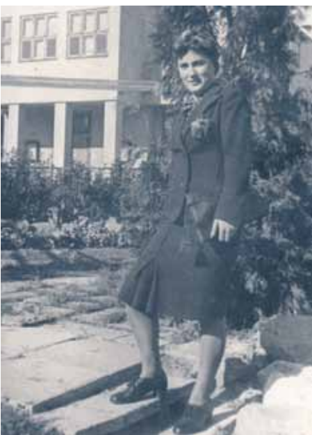
Fragment budynku kina w czasie wojny