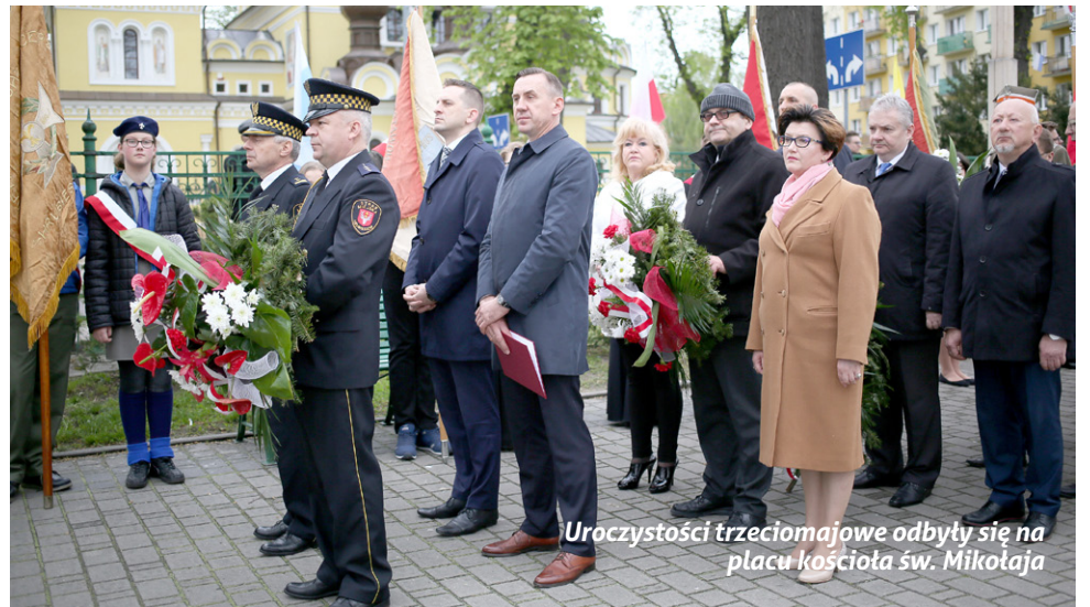
Uroczystości trzeciomajowe odbyły się na placu kościoła św. Mikołaja