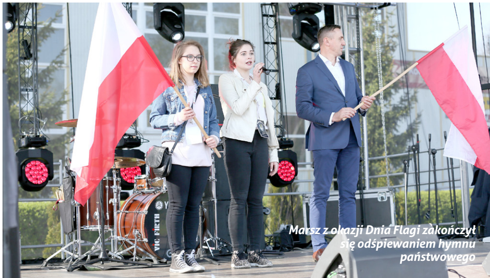
Marsz z okazji Dnia Flagi zakończył się odśpiewaniem hymnu państwowego