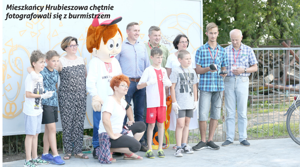
Mieszkańcy Hrubieszowa chętnie fotografowali się z burmistrzem