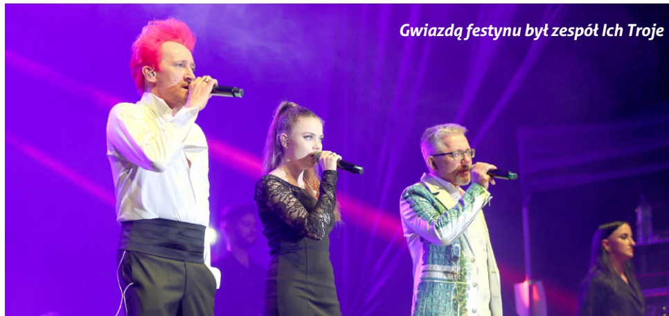
Gwiazdą festynu był zespół Ich Troje